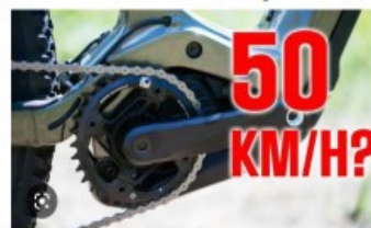
Lo sblocco del motore di una ebike e i rischi connessi

acquistando kit su siti online, vuol dire far raggiungere alla bicicletta una velocità fino a 45 km/h ma anche più.