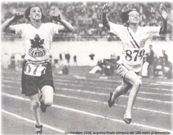
Amsterdam 1928: la prima finale olimpica dei 100 metri al femminile

100 anni di emancipazione femminile attraverso lo sport, per portare all'attenzione del pubblico temi legati all'uguaglianza di genere e al contrasto agli stereotipi.