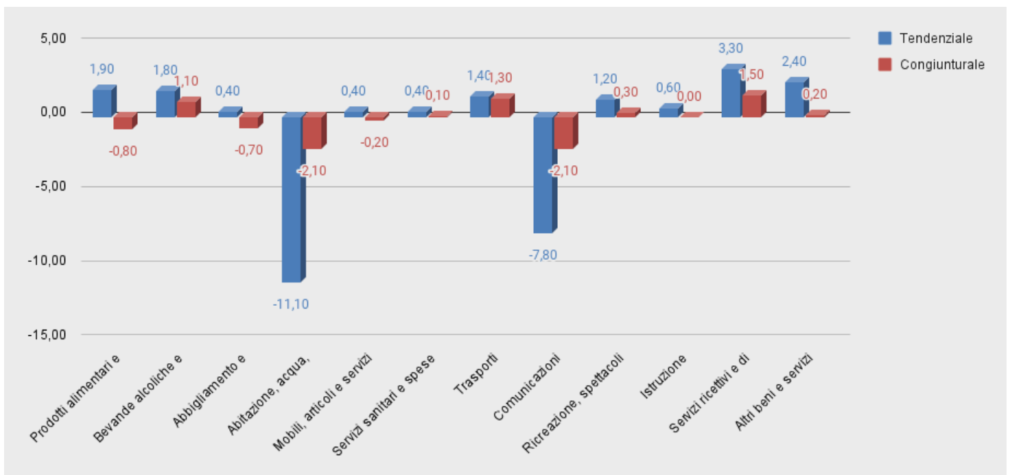
Figura 1.: Divisioni - variazioni tendenziali e congiunturali per il mese di Febbraio

Nel grafico che segue è riportato l'andamento del tasso di variazione (sia tendenziale che congiunturale) relativo alle Divisioni.