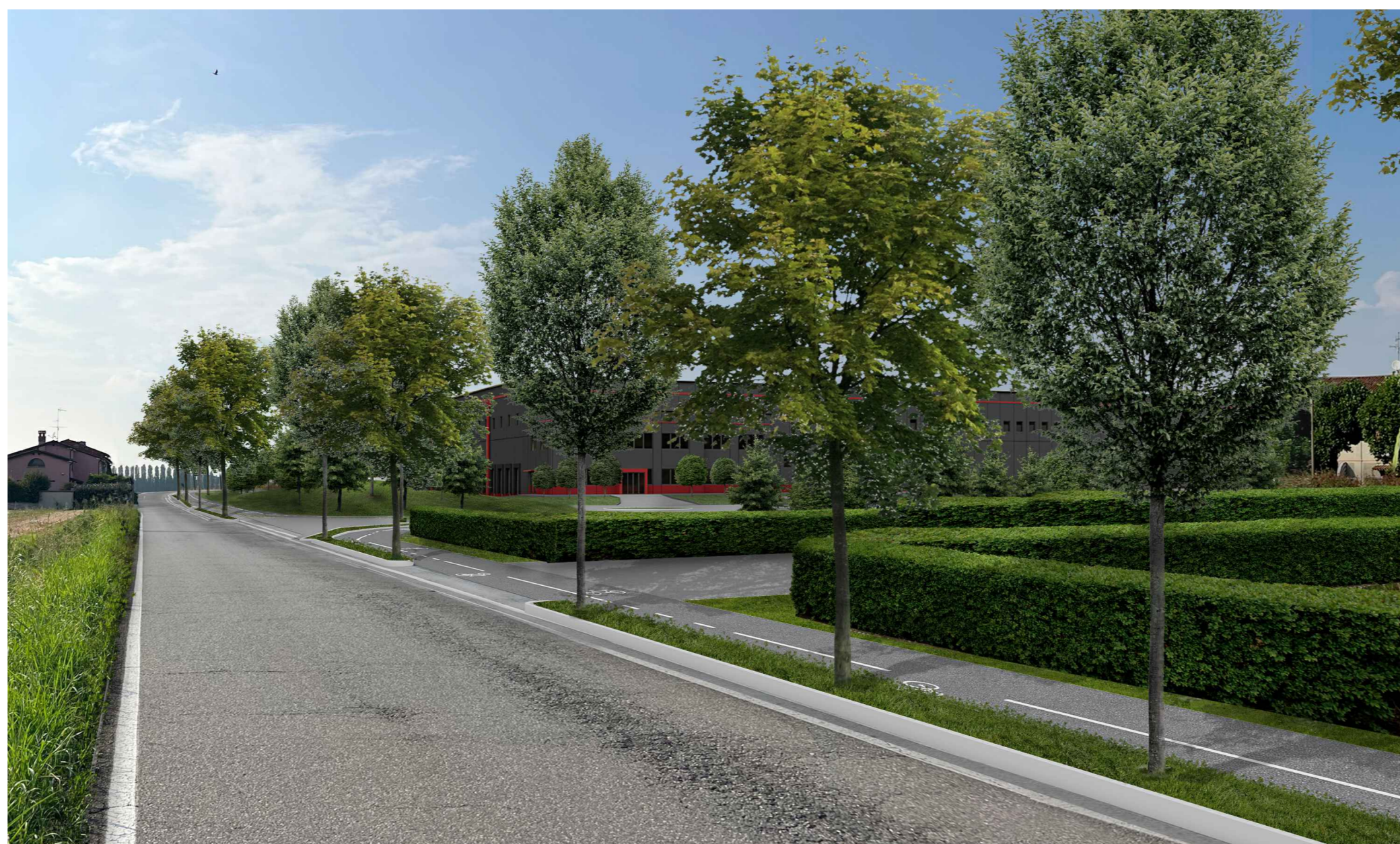
F1. Fotoinserimento Via Sesto lato est - Progetto