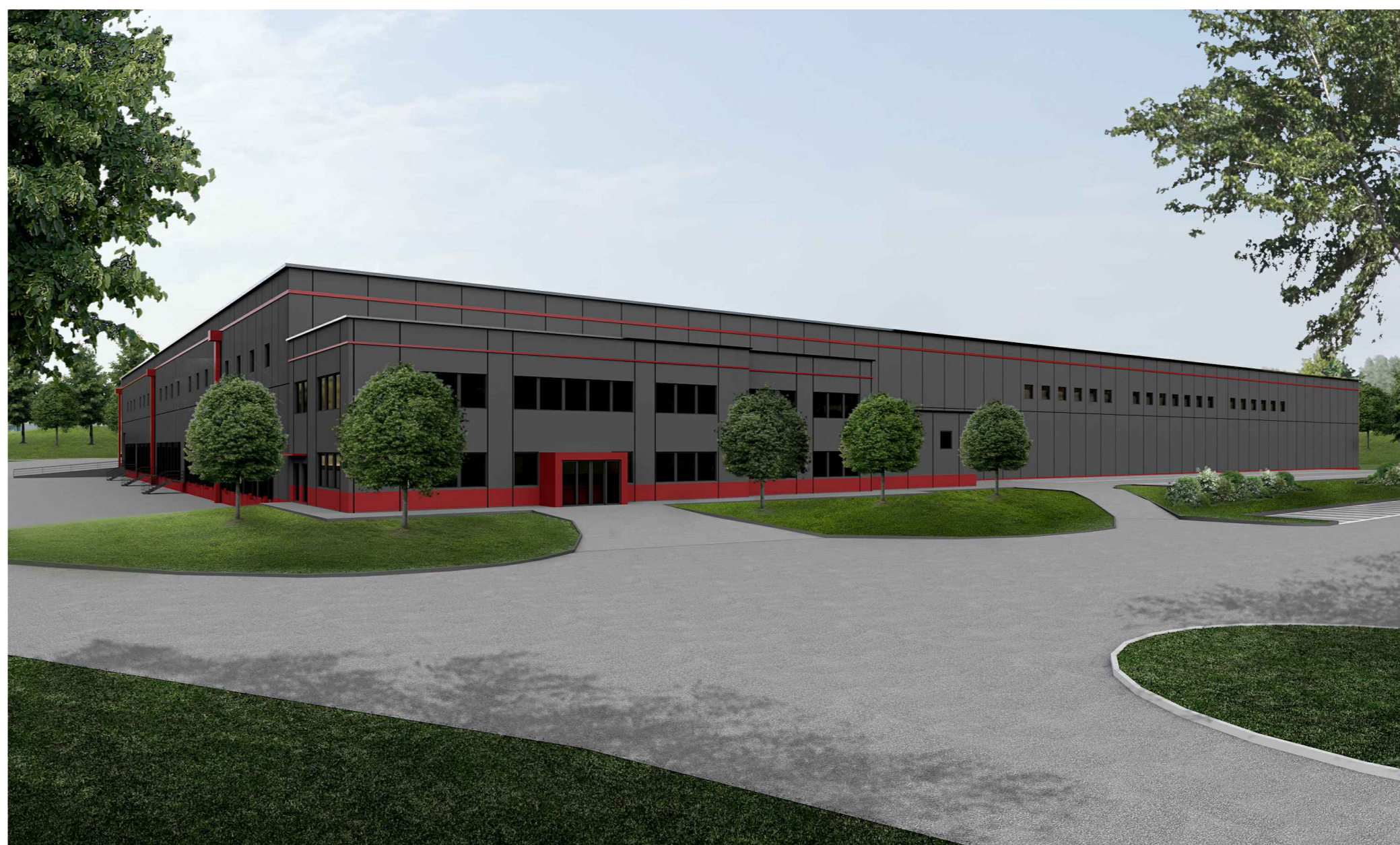
F4. Fotosimulazione angolo sud-est - Progetto