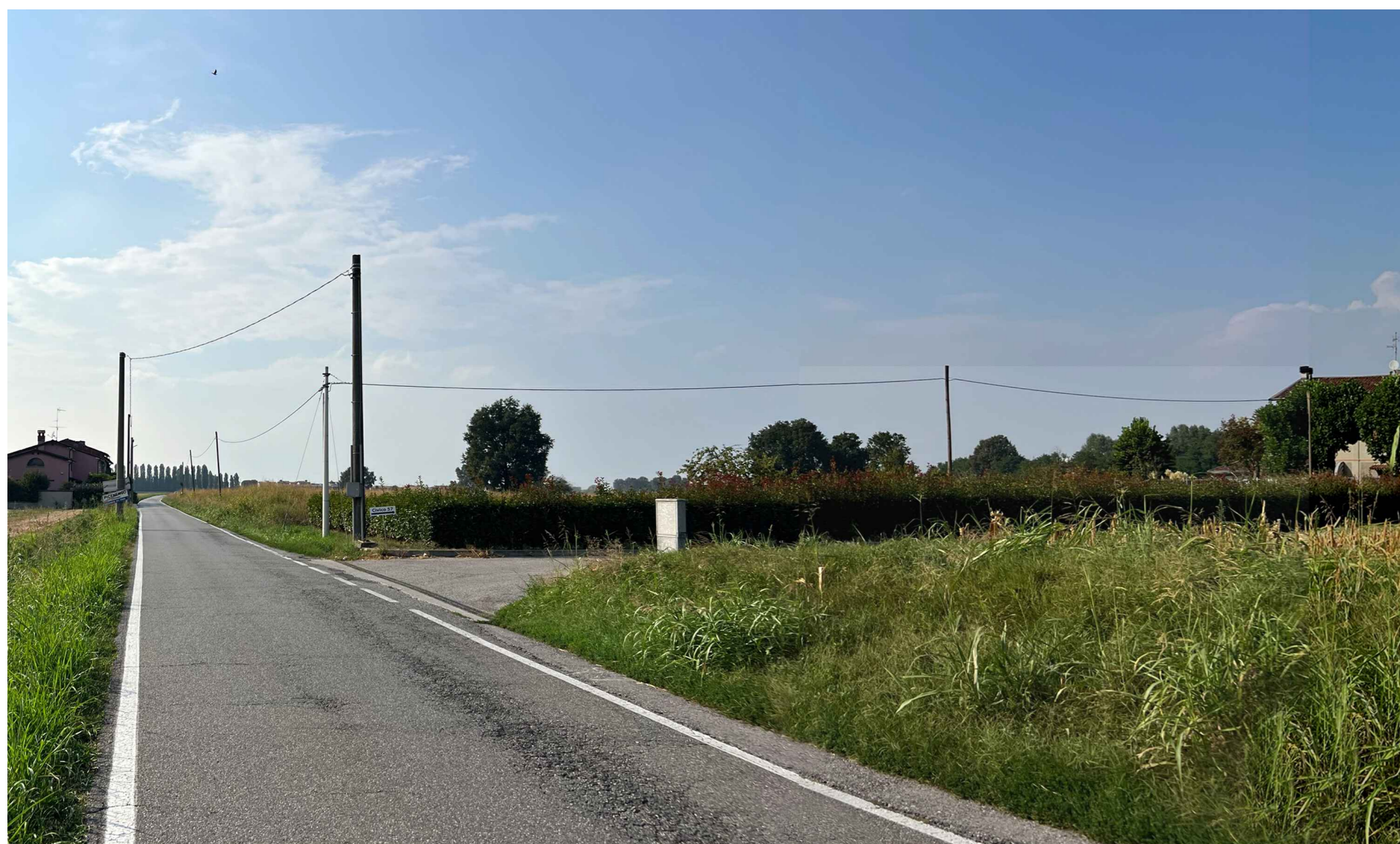
F1. Fotogramma Via Sesto lato est - Stato di Fatto