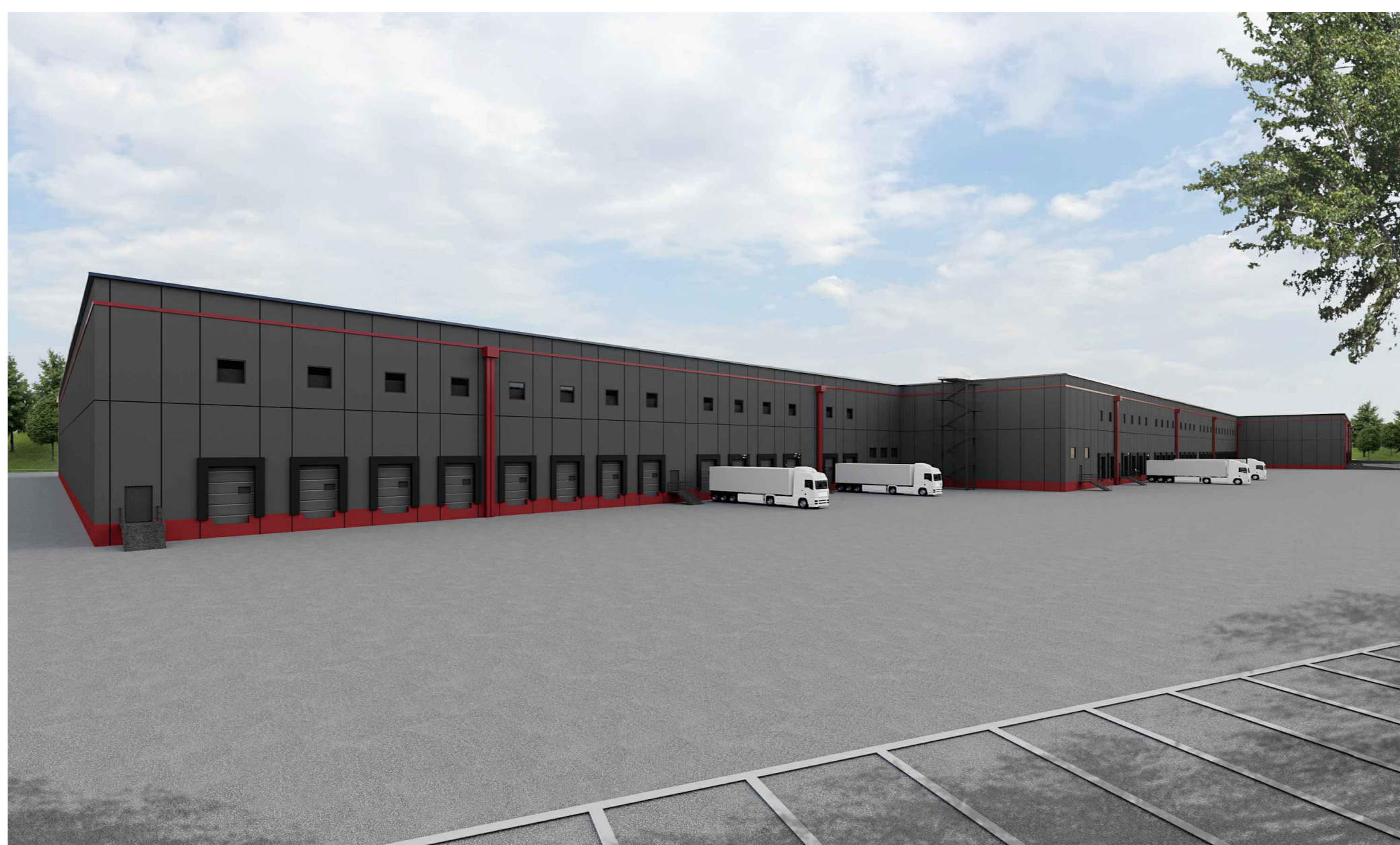
F5. Fotosimulazione angolo sud-ovest - Progetto