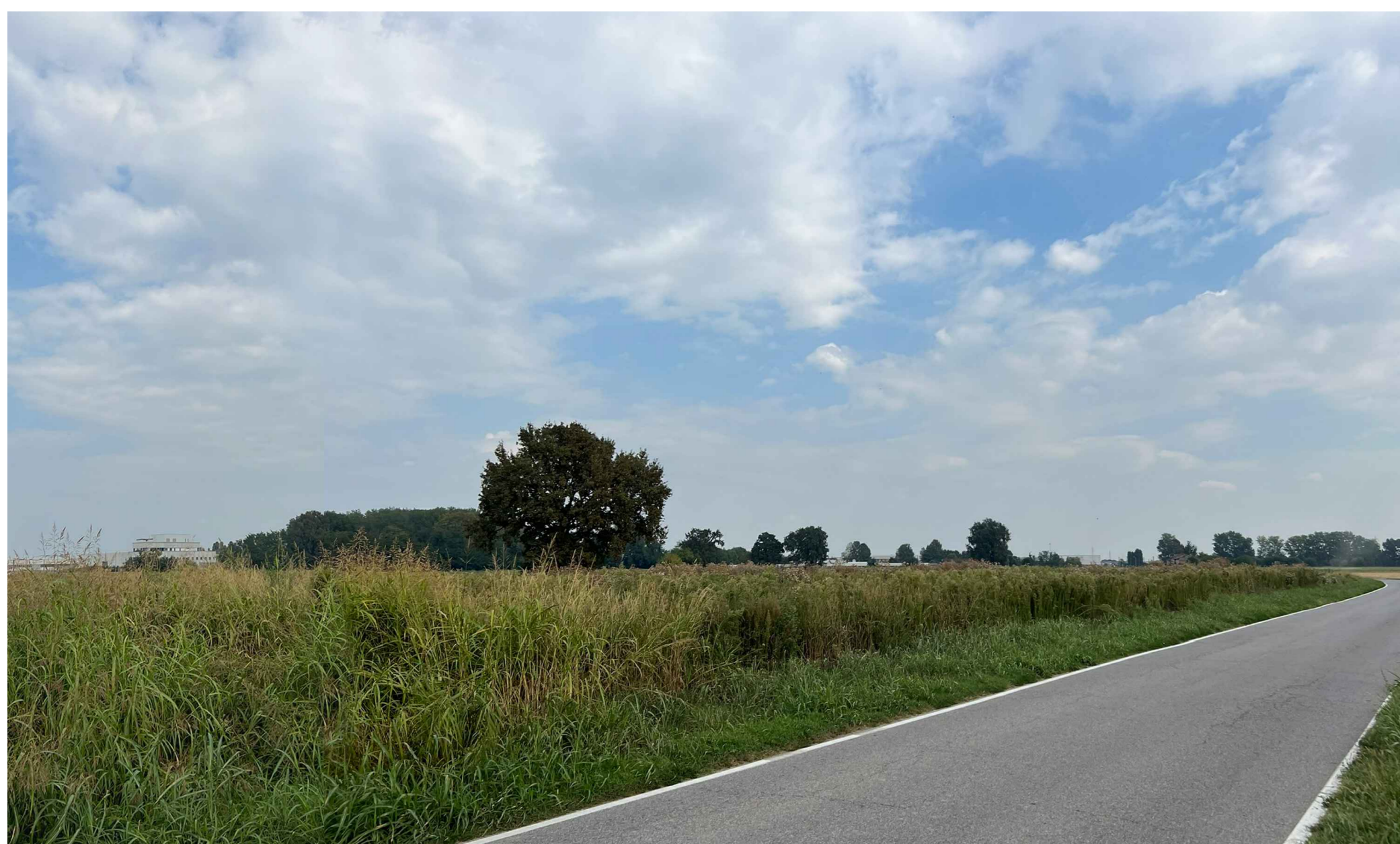
F2. Fotogramma Via Sesto lato ovest - Stato di Fatto