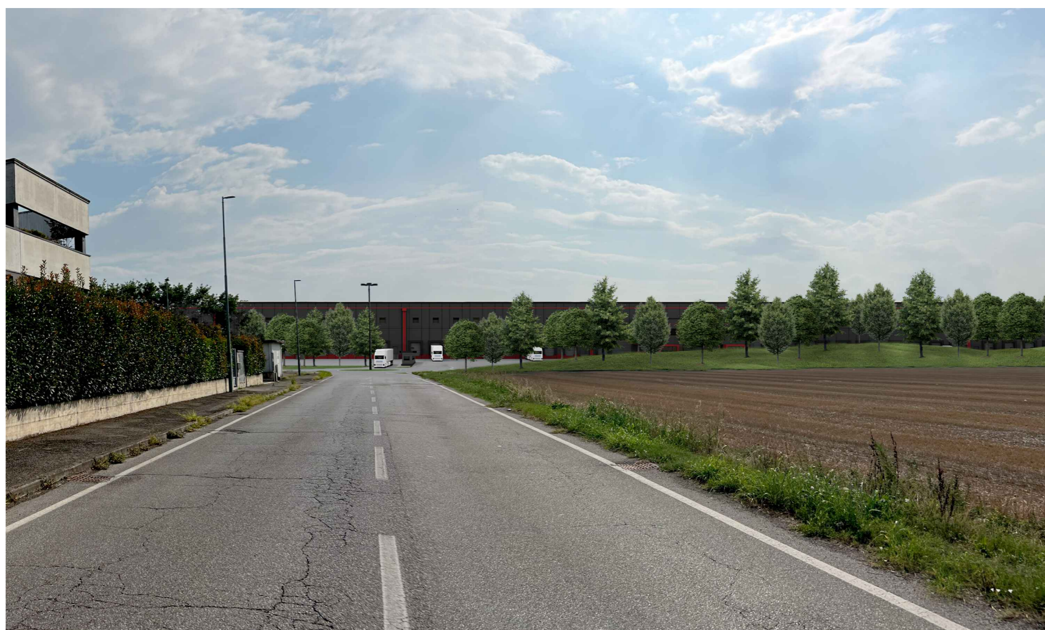
F3. Fotoinserimento lato nord da Via delle Viole - Progetto