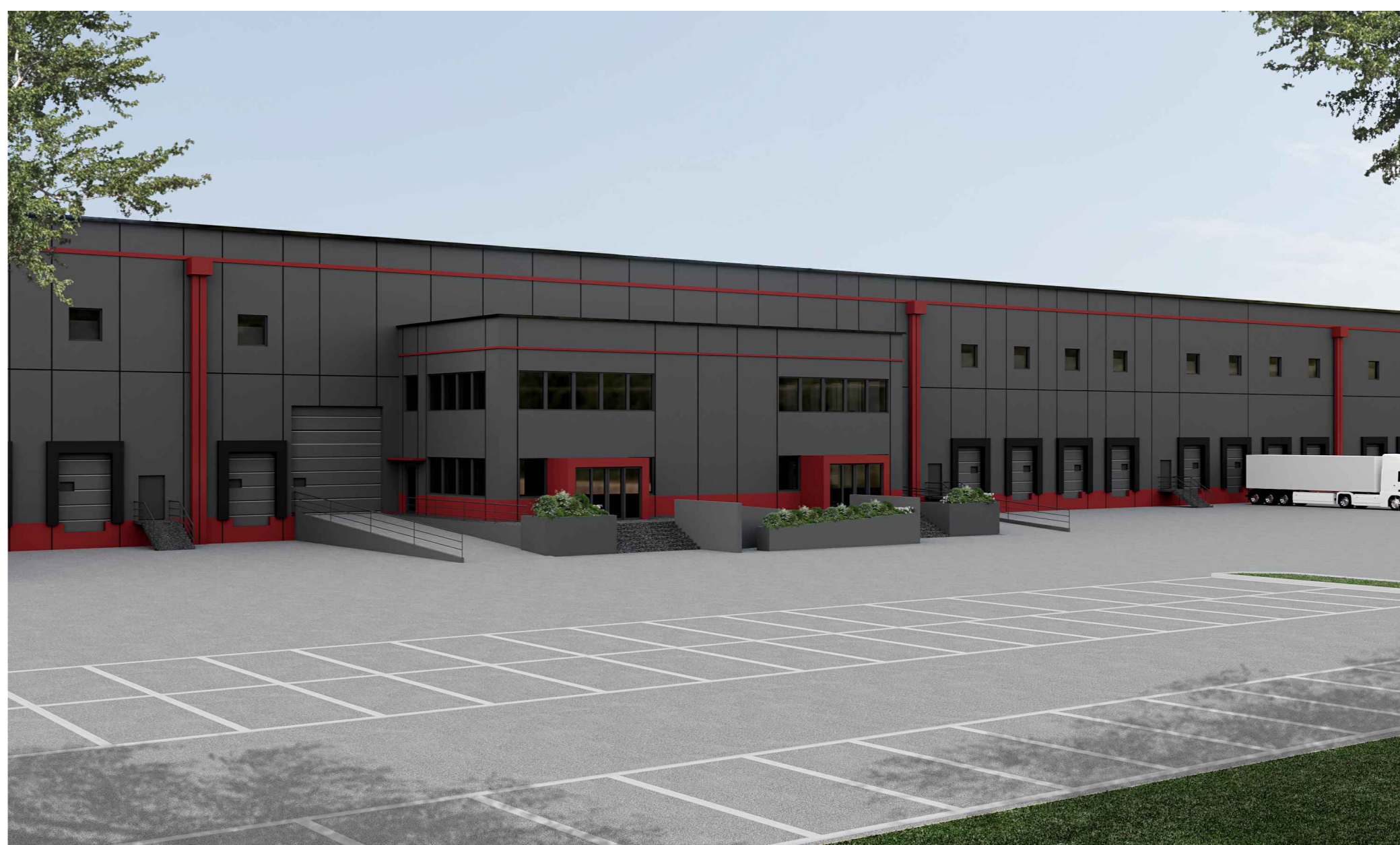
F6. Fotosimulazione lato nord - Progetto