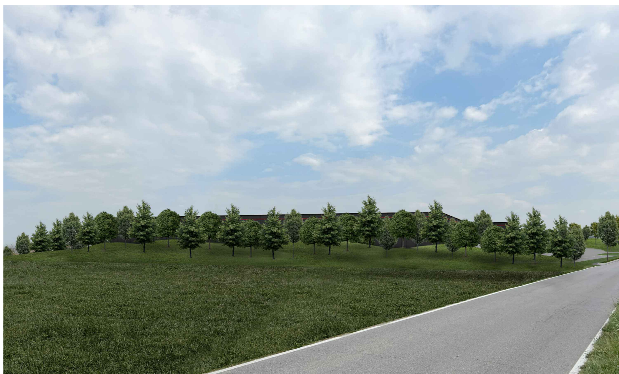
F2. Fotoinserimento Via Sesto lato ovest - Progetto