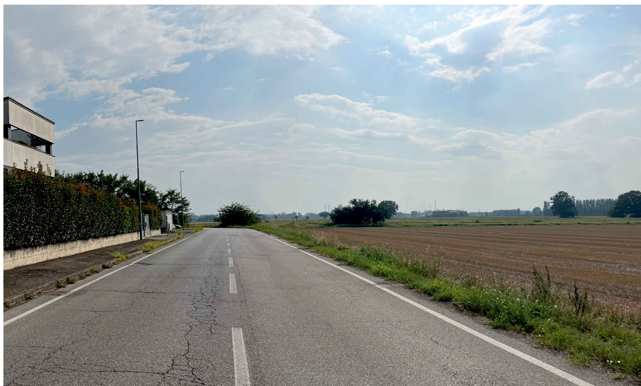
F3. Fotogramma lato nord da Via delle Viole - Stato di Fatto